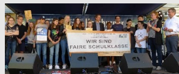
Auszeichnung als „Faire Klasse“