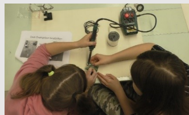
Schülerinnen löten die Mäuse

Dies innovative Nachhaltigkeitsprojekt stieß auf Interesse von Politik – vom Ortsvorsteher bis zum Landrat. Beide Politiker können zukünftig selbst mit fairen Computermäusen am Computer arbeiten. Die beiden Schulklassen trugen das Thema Faire Computermäuse weiter in die Öffentlichkeit und stellten bei einem Fairtrade-Markt in Homburg die Thematik „Faire Computermäuse“ und nachhaltige Elektronik in den Mittelpunkt. Die von Schülern gelöteten Computermäuse wurden zum Teil über den Eine Welt-Laden Homburg verkauft. In dem Fachgeschäft des Fairen Handels wurden die Mäuse im September 2019 als Produkt des Monats ( http://weltladen-homburg.de/der-laden/produkt-des-monatsa ) angeboten. Das Schüler- Engagement für den Fairen Handel wurde auch prämiert, die beiden Klassen erhielten für ihr vorbildhaftes Engagement die „Auszeichnung „Faire Schulklasse – Klasse des Fairen Handels “, Infos: www.faire-klasse.de .