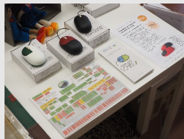
Faire Mäuse vom Lötworkshop sind Produkt des Monats im Weltladen